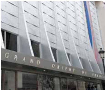
Siège du Grand Orient de France (16, rue Cadet - Paris 9)

«A la recherche d'un progrès qui profite à tous»