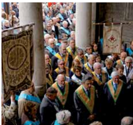
Rassemblement du 1 er Mai au Père Lachaise

«Une obédience historique et démocratique»